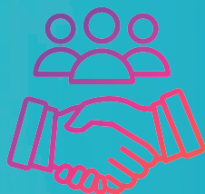
ZDEEP Puerta del Istmo